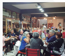
HOTEL LA POSADA