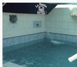
HOTEL LA POSADA