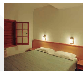
HOTEL LA POSADA