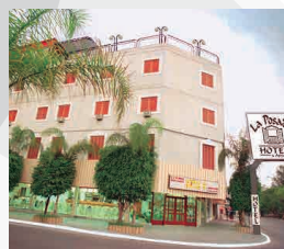
HOTEL LA POSADA